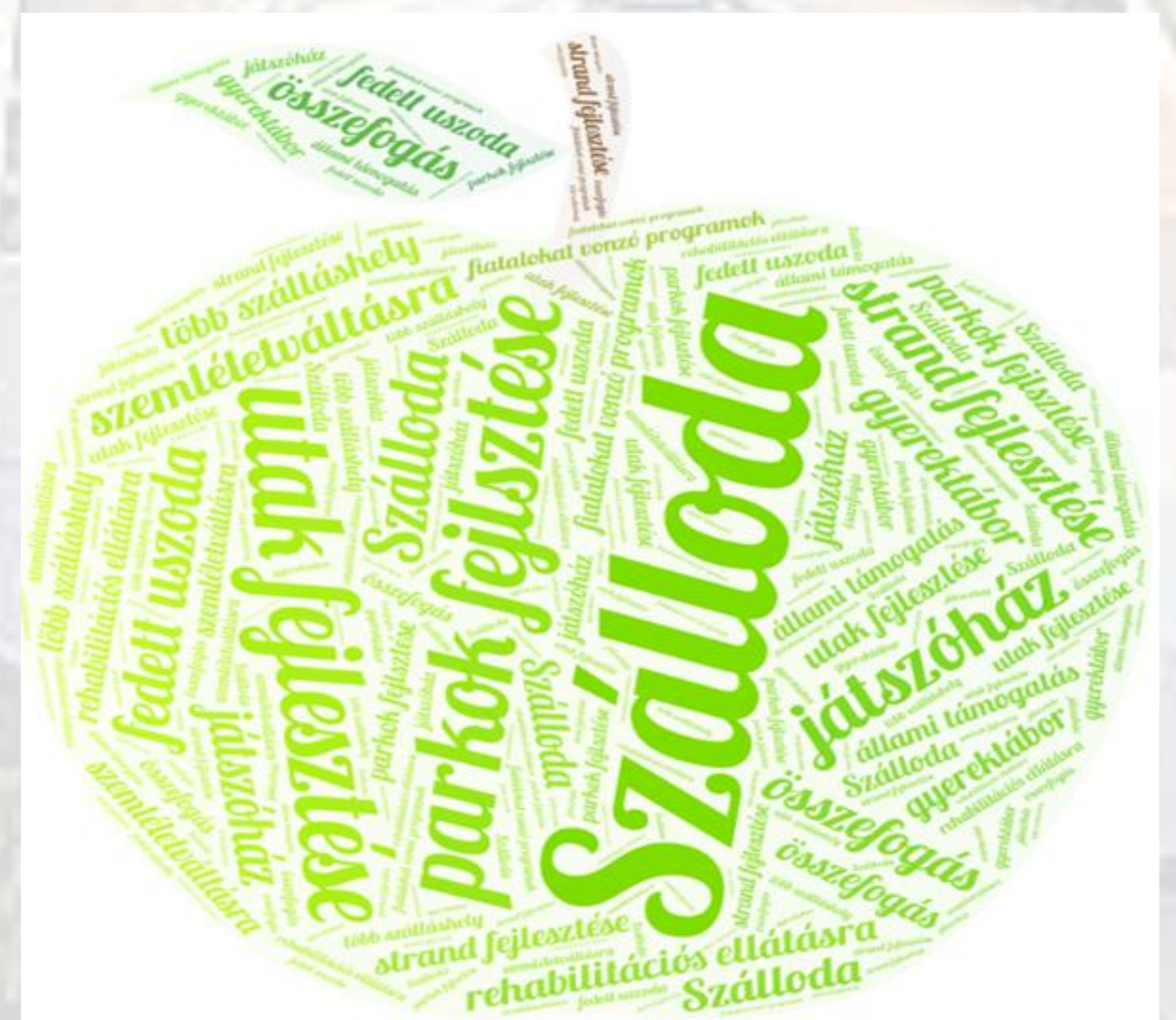
A kitöltők asszociációi (szófelhő) a helyi turizmus fellendítésének alapjairól