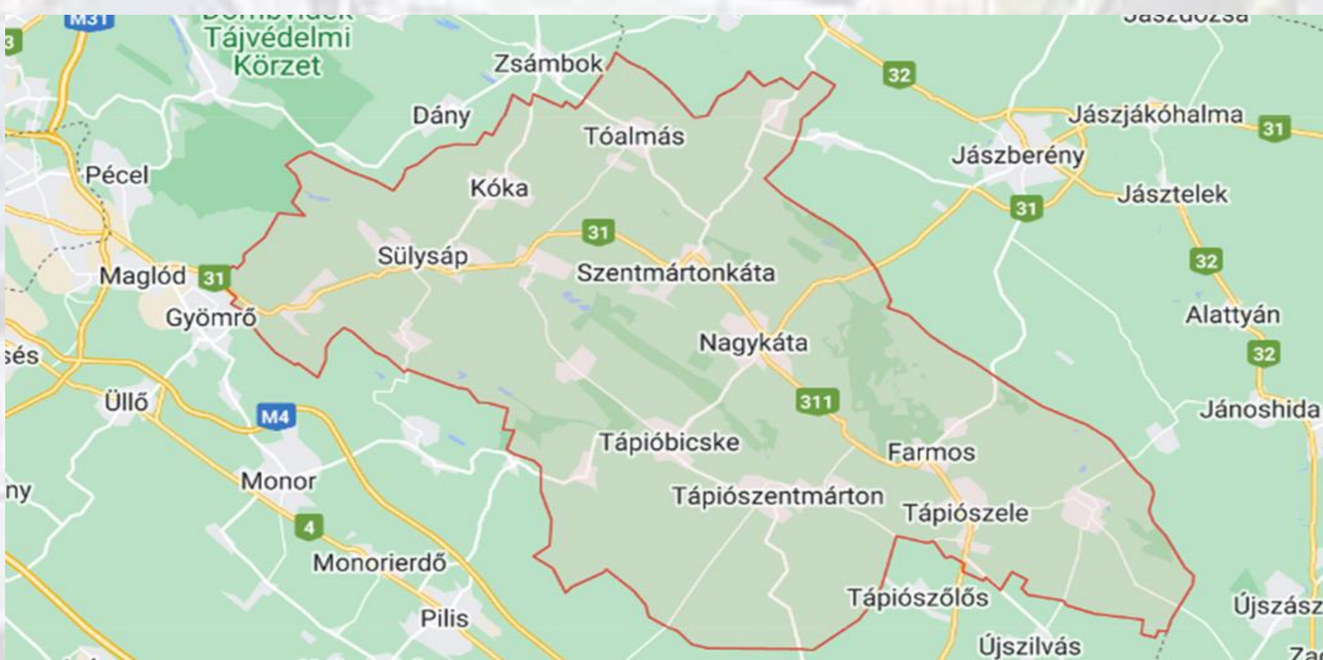
Nagykáta és térségének elhelyezkedése

Nagykáta Pest vármegyében fekvő kisváros, a Nagykátai járás, a Tápióvidék és a Galgamente központja, amely 21 települést foglal magába. A település népessége kis ütemben fogyatkozik, alapvetően kismértékű elvándorlás jellemzi.